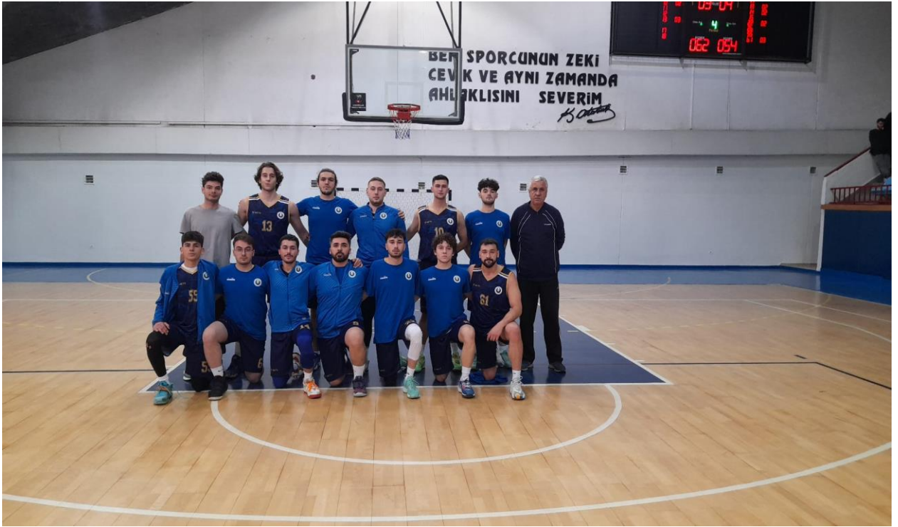
Üniversiteler Arası Basketbol Türkiye Şampiyonası