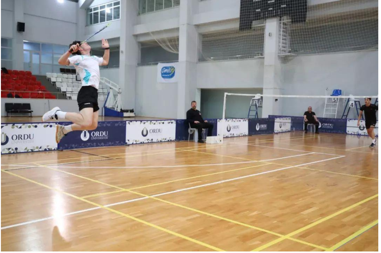
Üniversiteler Arası Badminton Türkiye Şampiyonası