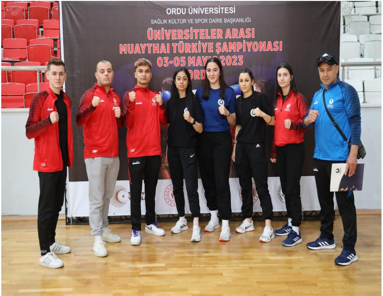
Üniversiteler Arası Muaythai Türkiye Şampiyonası