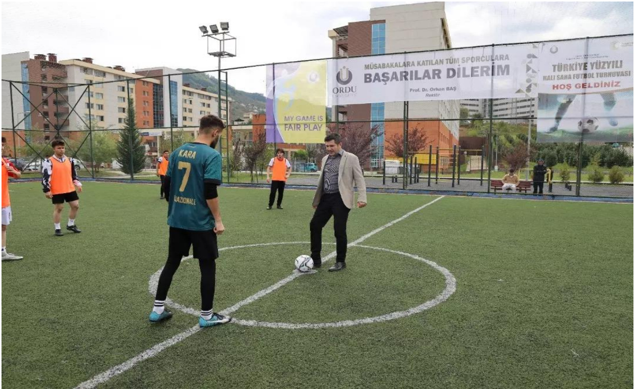
Halı Saha Turnuvası