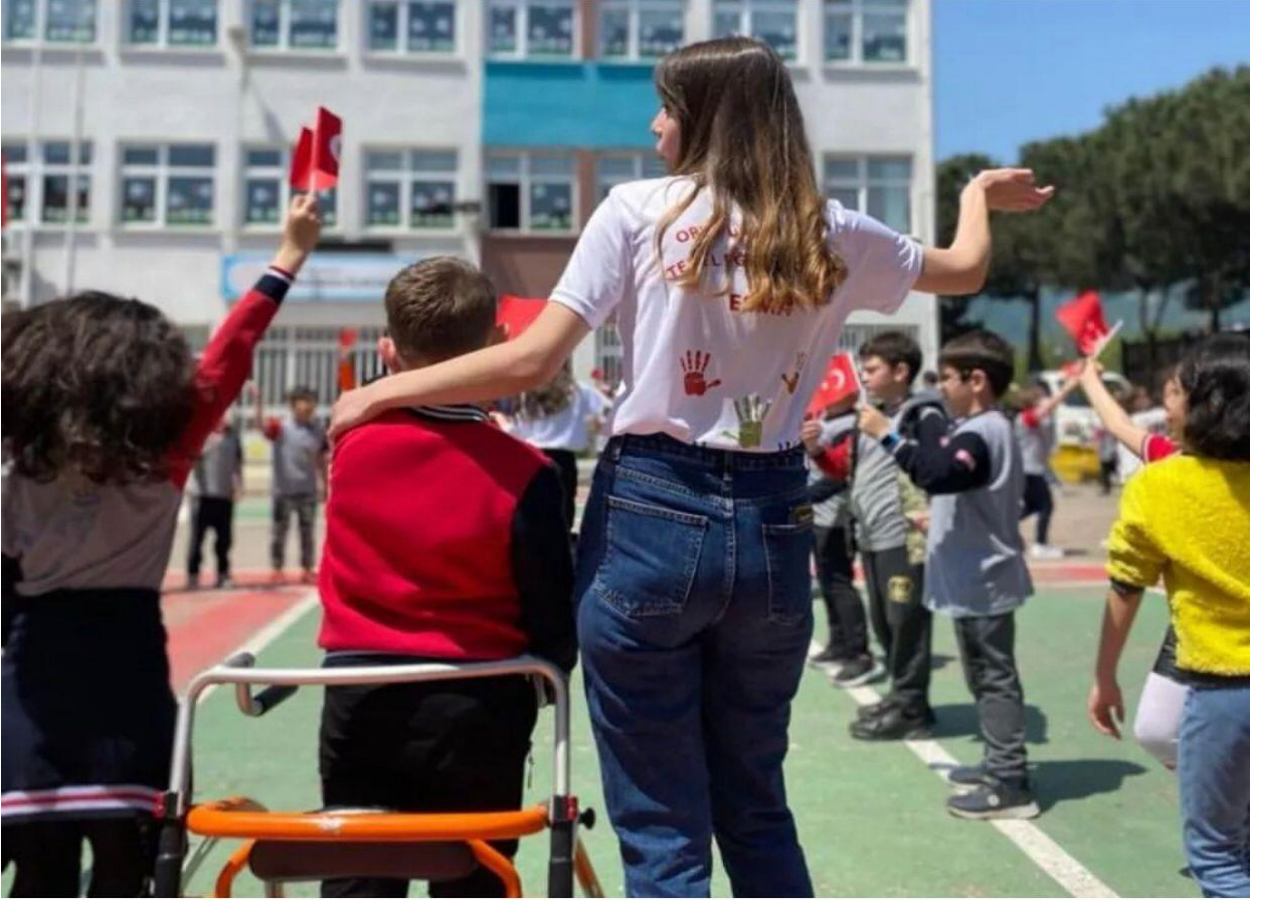
Altınordu İlkokulu Etkinliđi