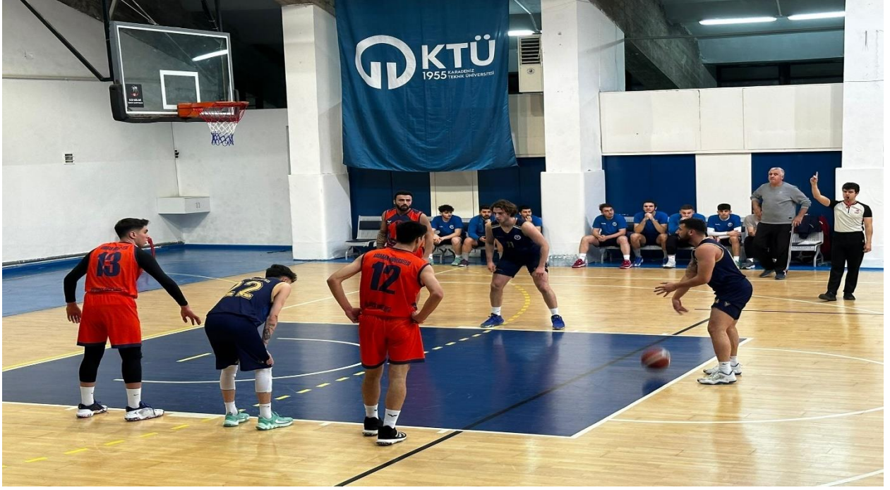
Üniversiteler Arası Basketbol Türkiye Şampiyonası