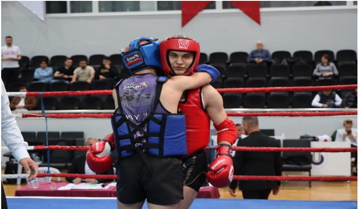
Üniversiteler Arası Muaythai Türkiye Şampiyonası