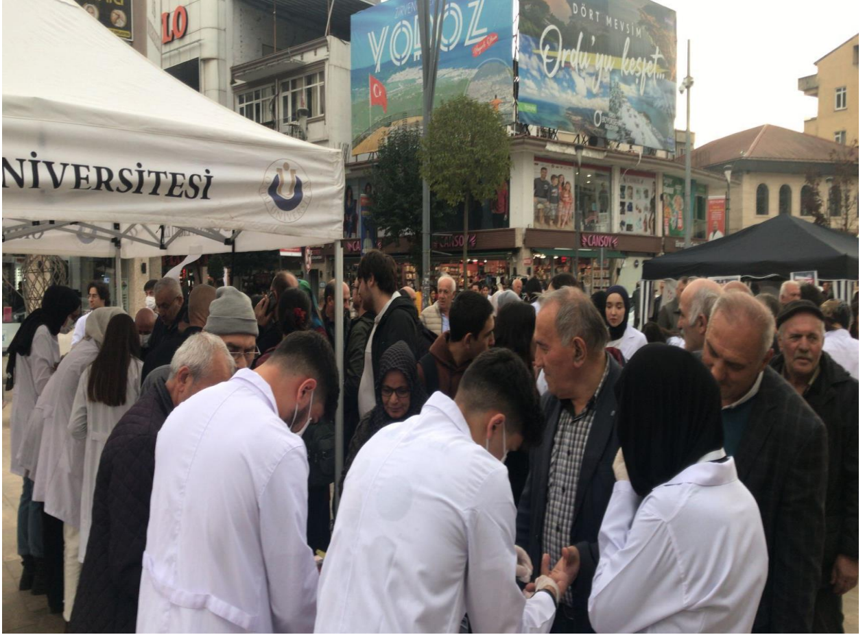
Farkındayım Şekerim Etkinliği