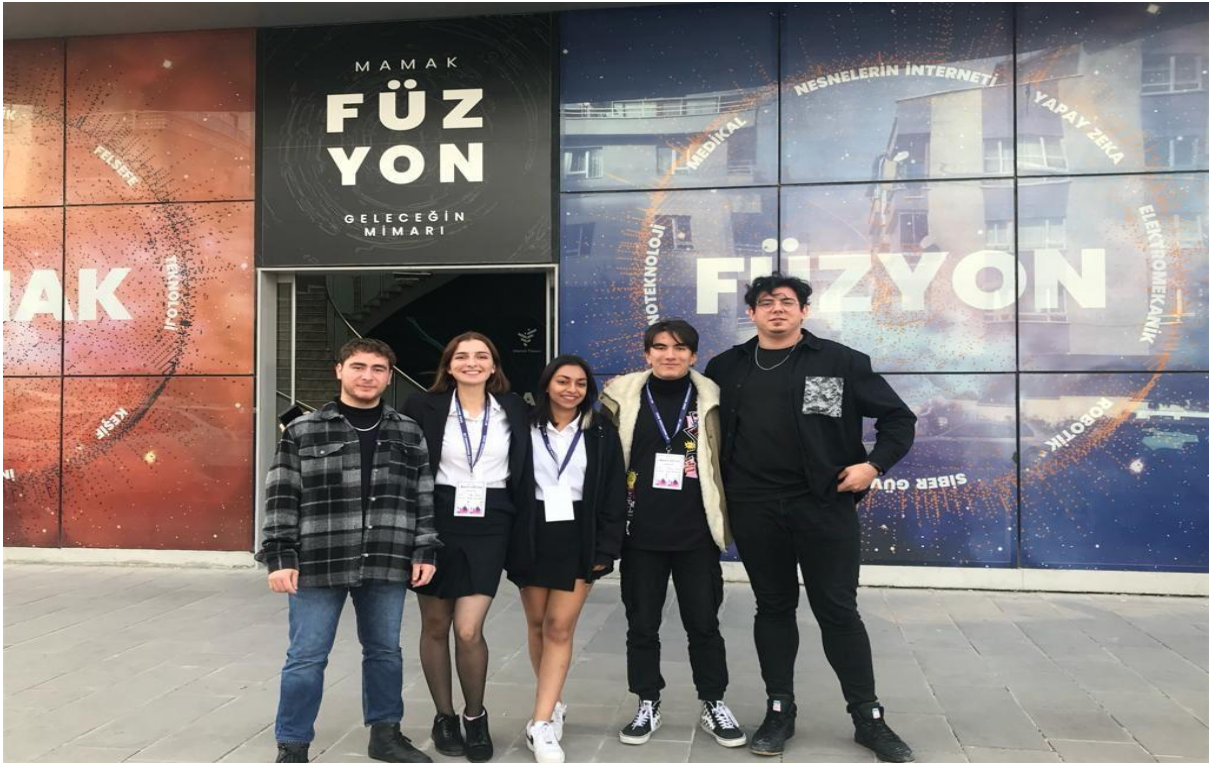
Bioinovasyon Yarışması Etkinliği