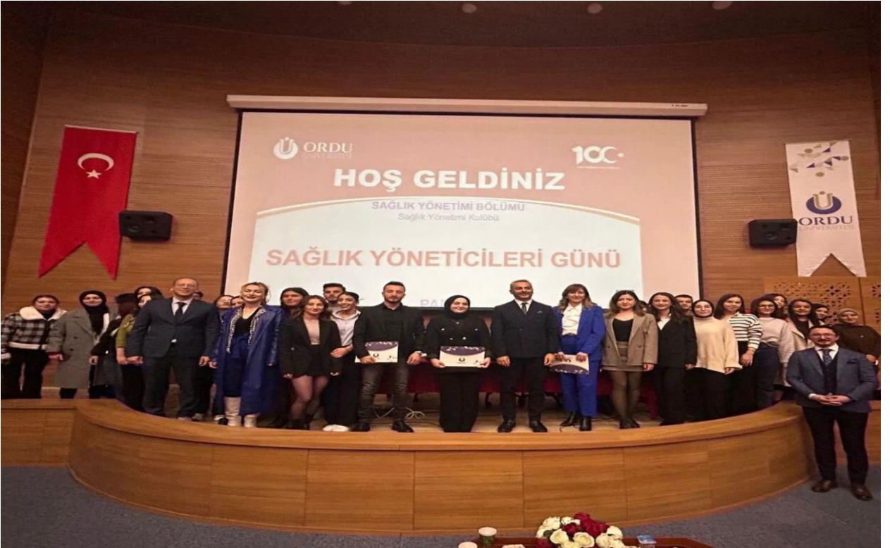
Sađlık Yöneticileri Günü Etkinliđi